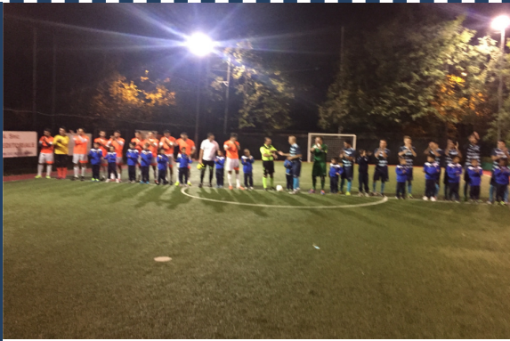
Il Real a Vallerano, sceso in campo e subito uscito dal match