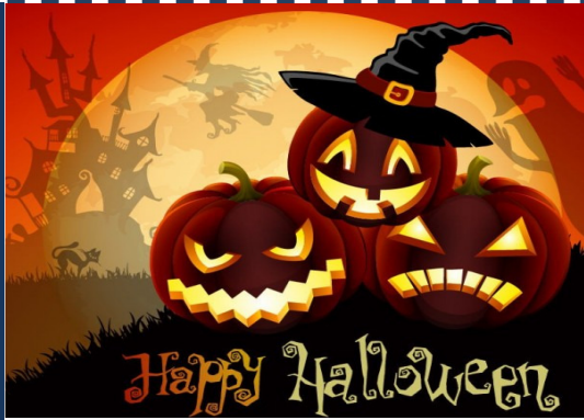
Niente dolcetto o scherzetto...solo 3 punti per il Real