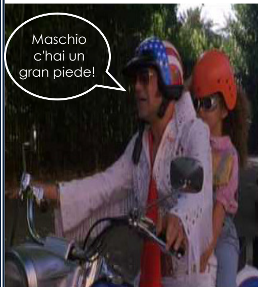
Da una citazione di Armando Feroci (alias Gallo Cedrone) l'ispirazione per il commento ai gol turanensi dell'ultima gara